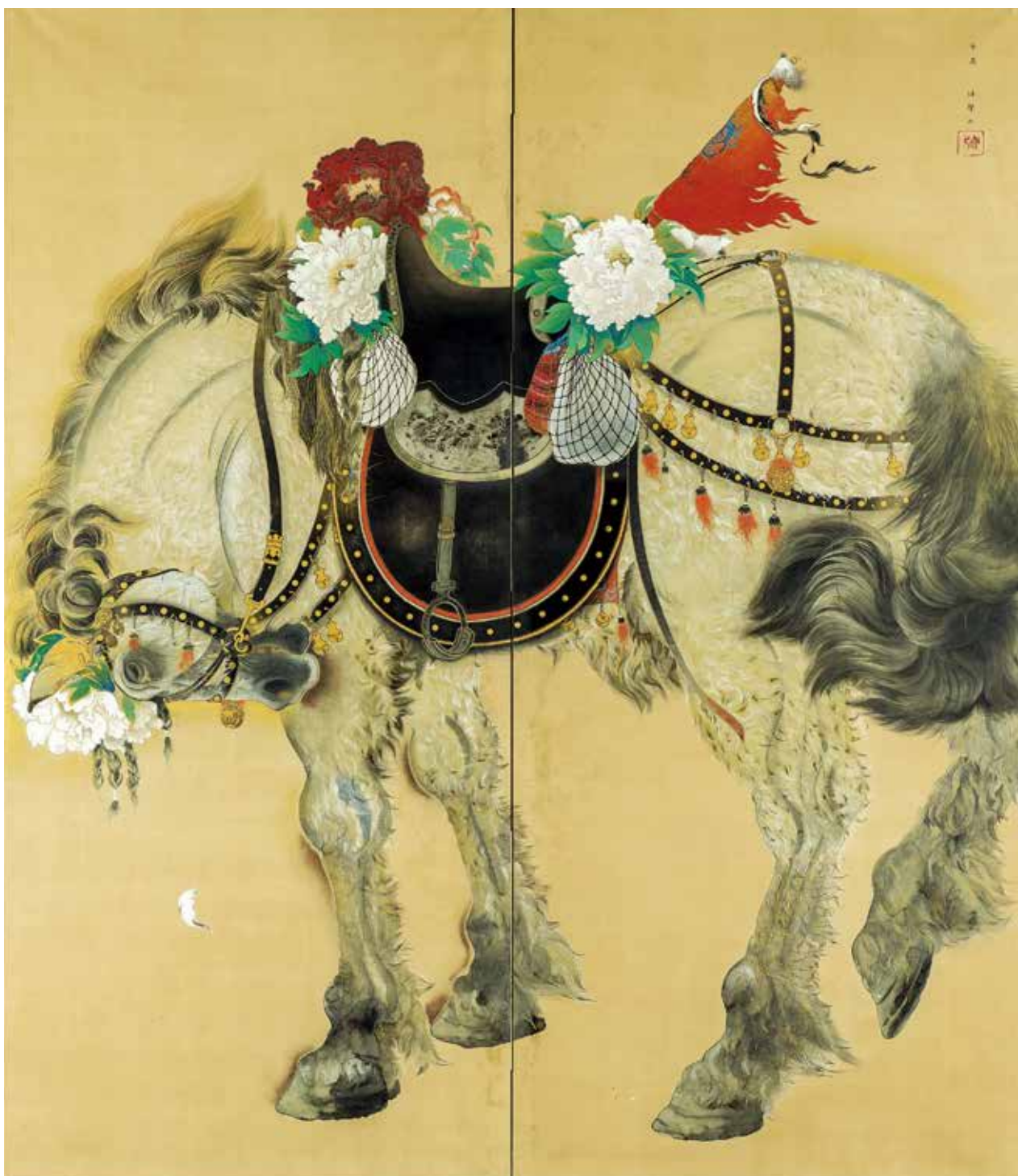
《檀陣》 1930年 個人蔵