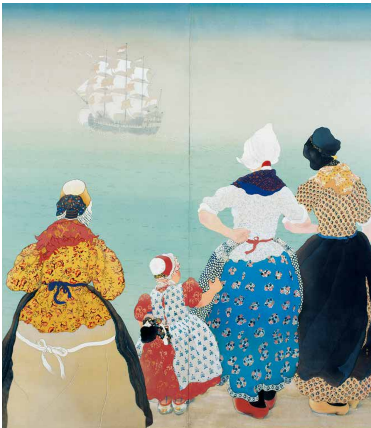
《長崎へ航く》 1931年 個人蔵