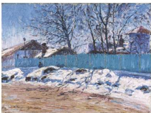
辻 永《ハルビンの冬》1917(大正6)年 石橋財団石橋美術館蔵