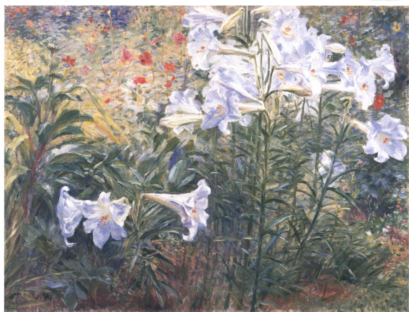
黒田清輝《鉄砲百合》1909(明治42)年 石橋財団石橋美術館蔵