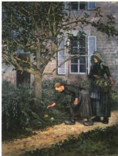
久米桂一郎《林檎拾い》1892(明治25)年 久米美術館蔵