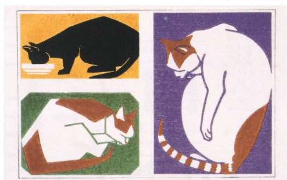
杉浦非水『非水創作圖案集』(文雅堂)より 1926(大正15)年 愛媛県美術館蔵