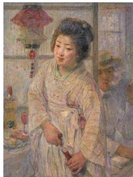
中澤弘光《カフェの女》1920(大正9)年 宮崎県立美術館蔵

今回の出品作のうち約半数は画家たちが10代から30代の時期の作品です。若き日の情熱を傾けて制作された、画家たちの青春の輝きをぜひご覧ください。