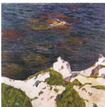
牧野虎雄《白き岩》1913(大正2)年 東京都現代美術館蔵