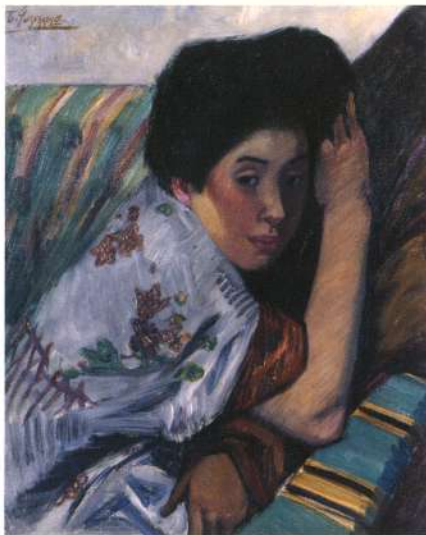
藤島武二《うつつ》1913(大正2)年 東京国立近代美術館蔵